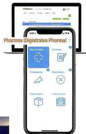
Pharmox (Digistrates Pharma)