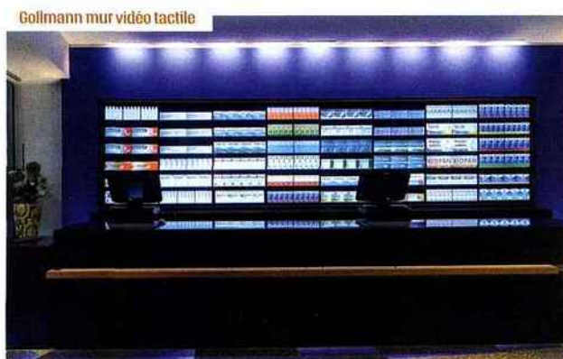
Gollmann mur vidéo tactile