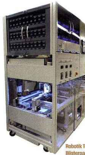
Robotik Technology Blisterpack

Composé d'écrans ultra-lumineux non-tactiles, d'une largeur de trame de seulement 3,5 mm entre chaque écran, le mur développé par Gollmann offre la possibilité de présenter des vidéos et des offres en intégrant jusqu'à 12 écrans. L'ajout d'un cadre permet d'apporter des fonctionnalités tactiles sur toute la zone d'affichage, pour accueillir jusqu'à 20 utilisateurs en même temps. Autre concept d'écran novateur, l'Arche digitale de Futuramédia, ajustable à tous les linéaires, est un dispositif connecté piloté à distance dont le mobilier en métal laqué habille l'intégralité du rayon et peut diffuser un contenu dynamique sur les produits, grâce à l'intégration d'un écran stretch et de deux réglottes digitales sur les côtés.