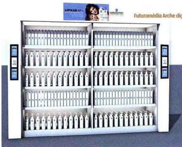
Futuramédia Arche digitale

Pharmonweb, agence conseil en marketing officinal, déploie une offre intégrant notamment un site vitrine, une page Facebook accessible depuis celui-ci et une application mobile. Quant à l'appli MyOmegaSmart, elle se positionne comme une aide quotidienne au « bien manger » aussi facile à vivre que possible : les utilisateurs ont simplement à envoyer des photos de leurs repas à des diététiciennes qui leur fournissent en retour des recommandations personnalisées. ☺